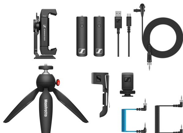
XSW-D Portable Lav Mobile Kit avec le nouveau câble pour mobile XSW-D

Outre la pince pour smartphone et le mini-trépied, le micro-cravate sans fil Sennheiser est vendu avec un câble TRS-TRS supplémentaire (également vendu séparément en tant que câble pour mobile XSW-D). Ce câble comporte un atténuateur pour optimiser la prise de son des appareils mobiles.