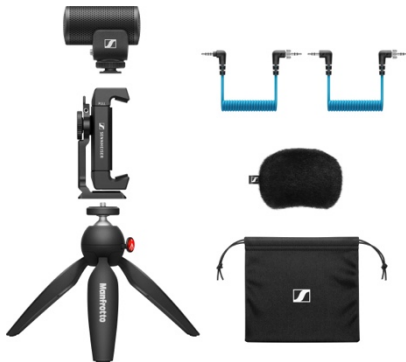
MKE 200 Mobile Kit

Les deux modèles MKE 200 et MKE 400 sont vendus avec des câbles TRS et TRRS de 3,5 mm à adapter respectivement sur une caméra DSLR/M ou un appareil mobile. Et avec le trépied Manfrotto PIXI Mini et la pince pour smartphone Sennheiser, les utilisateurs des versions Mobile Kit sont parés pour toutes les situations d'enregistrement de vlogs et autres contenus.