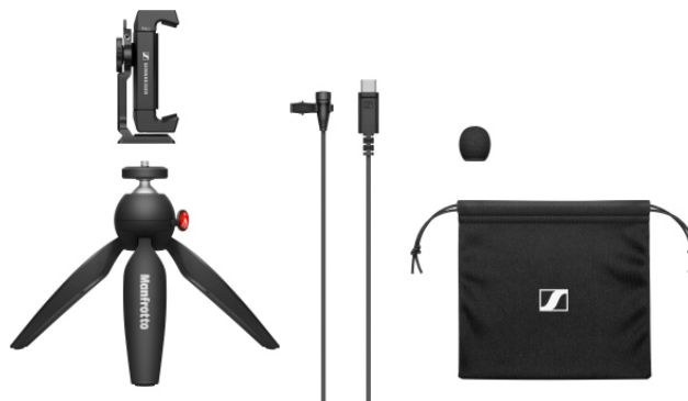
XS Lav USB-C Mobile Kit

Ce kit prévoit l'ajout d'une pince pour smartphone et d'un trépied PIXI Mini au micro-cravate sans fil USB-C de Sennheiser pour réunir les meilleures conditions d'enregistrement de vlog et de podcast.